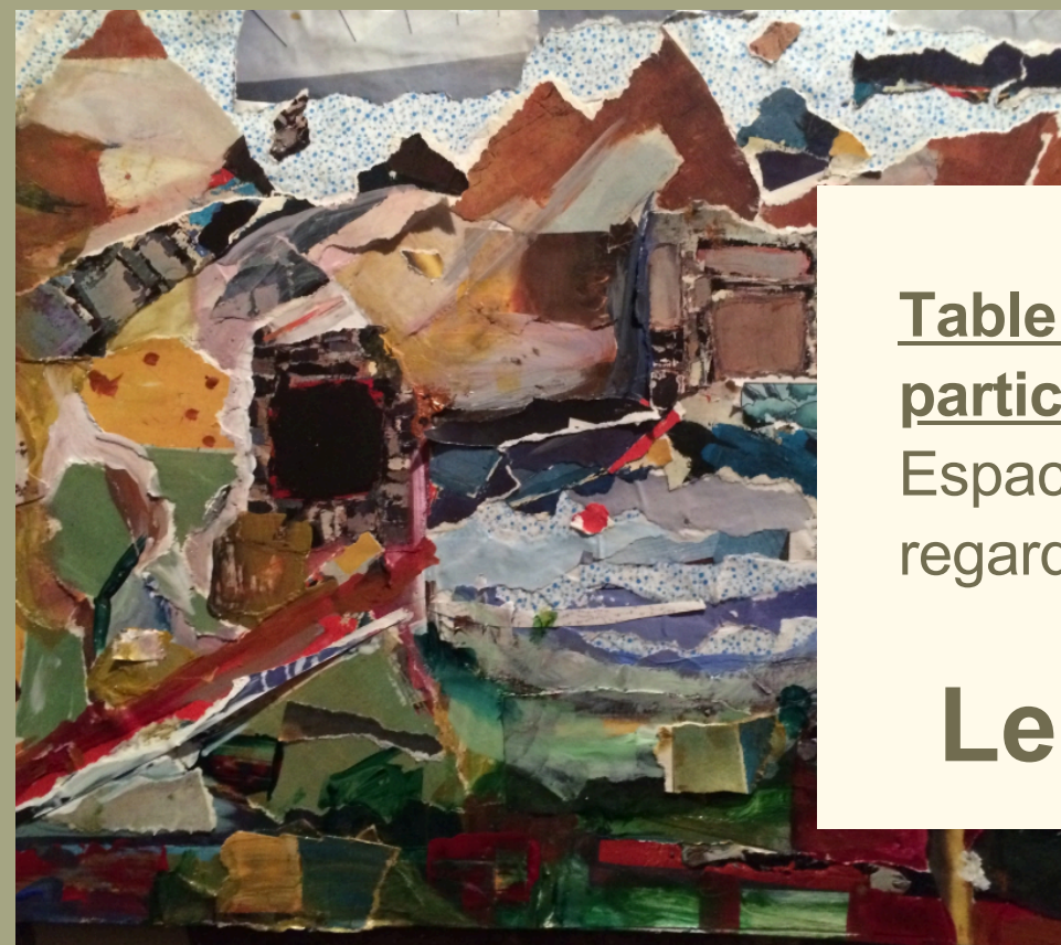
Table ronde / atelier participatif.

Espace de dialogue autour du regard et du désir féminin.