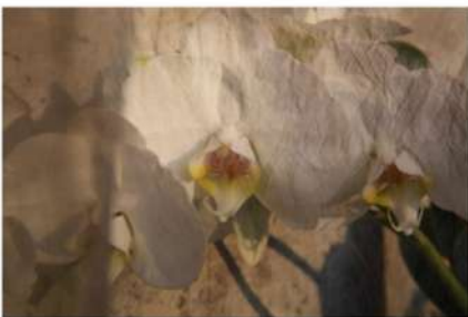
ESTHER LÜTHI Orchid II, 2025

Tirage métal, impression haute définition ChromaLuxe. Sublimation sur aluminium. 70 × 50 cm