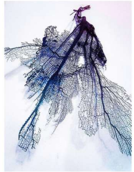
ESTHER LÜTHI Connected, 2025

Tirage Fine Art, double exposition. Sur support aluminium. 70 × 50 cm