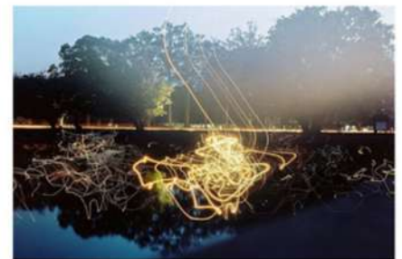
ESTHER LÜTHI Sign, 2006

Tirage métal – impression haute définition ChromaLuxe. Sublimation sur aluminium. 50 × 70 cm