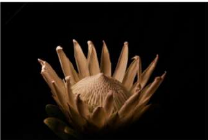
ESTHER LÜTHI La Reine 1, 2025

Tirage Fine Art. Sur support aluminium. 70 × 50 cm