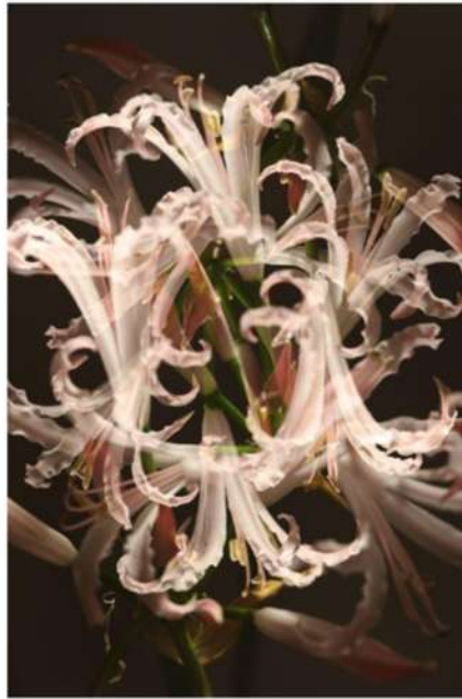
ESTHER LÜTHI Together, 2025

Tirage Fine Art, double exposition. Sur support aluminium. 70 × 50 cm