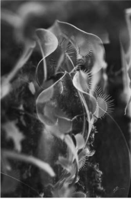
ESTHER LÜTHI Venus, 2025

Tirage Fine Art, double exposition. Sur support aluminium. 70 × 50 cm