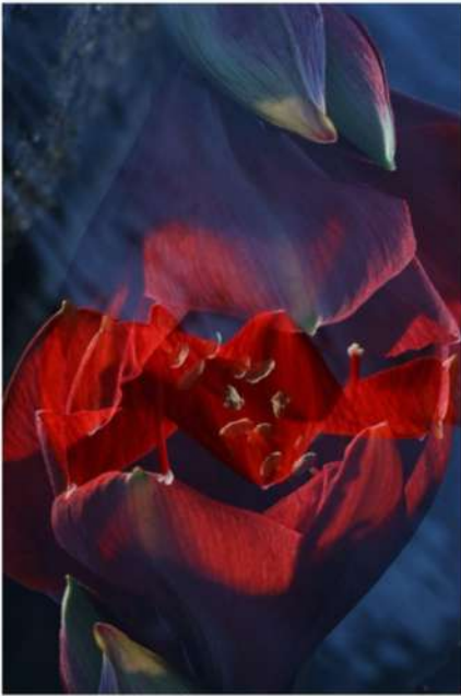
ESTHER LÜTHI Amaryllis by the river, 2025

Tirage Fine Art, double exposition. Sur support aluminium. 70 × 50 cm