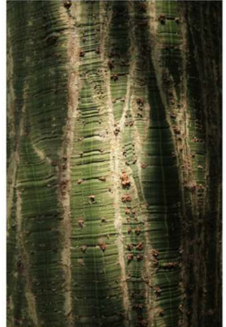
ESTHER LÜTHI Where are you?, 2010

Tirage métal, impression haute définition ChromaLuxe. Sur support aluminium. 70 × 50 cm