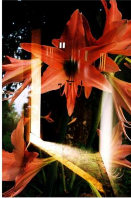
ESTHER LÜTHI Lilly, 2006

Tirage Fine Art, double exposition. Sur support aluminium. 70 × 50 cm